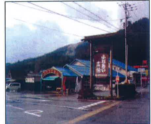
ふらっと美山 外観