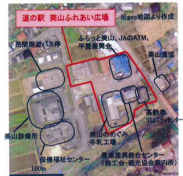
拠点周辺の位置図